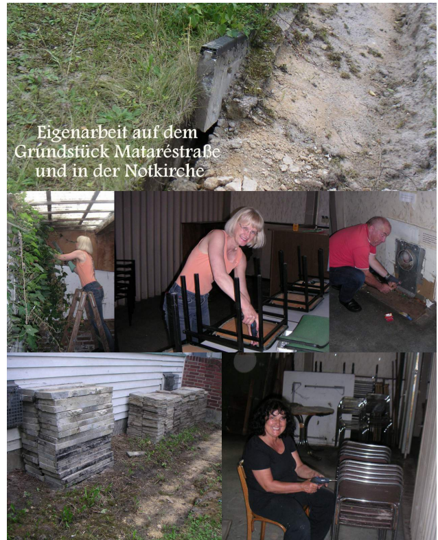
Eigenarbeit auf dem Grundstück Mataréstraße und in der Notkirche