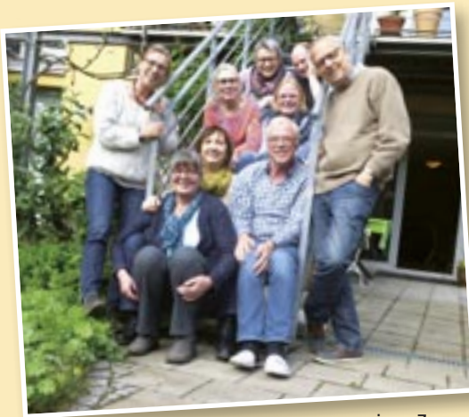
Die Baugruppe Wiesental freut sich auf weitere Bewerber.

Wohnprojekt Patchwork hatte sie bereits interessiert und sie dachte über einen Umzug nach. Dann wurde ihr Mann plötzlich krank. Von einem Tag auf den anderen ändert sich das Leben. Das Paar verkaufte das Haus und zog in eine Wohnung nach Aachen. Jetzt freuen sie sich darauf, bald in ein weiteres Haus der LebensWeGe ins Wiesental zu ziehen.